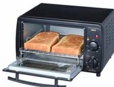
山型食パンが2枚同時に焼ける