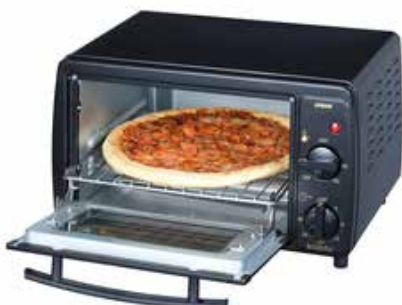
直径約23cmのピザが丸ごと焼ける