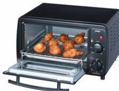
揚げ物も油を使わずヘルシーに調理